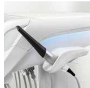
SiroCam AF+ в дополнительном держателе