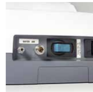
Комплект клапанов для внешних устройств