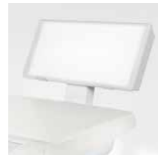
Панорамный рентгеновский аппарат