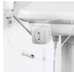
Встроенный насос для физиологического раствора