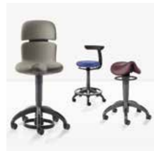
Рабочие стулья Hugo, Theo, Carl