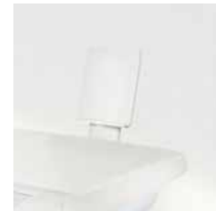
Держатель интеллектуальных устройств для планшета