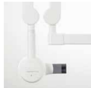
Блочная модель Heliocent Plus