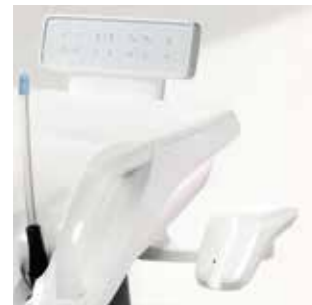
Лоток для хранения полимеризационной лампы SmartLite Pro