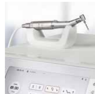
Электродвигатель BL Implant E (с подсветкой)